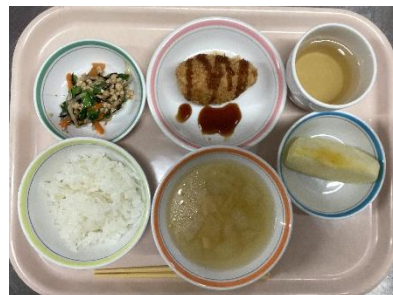
以前に提供した時の写真です