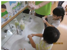
手洗い指導の様子