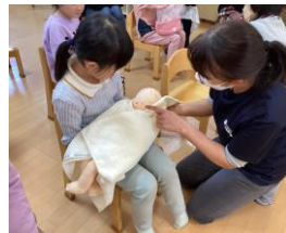
いのちのお話で、赤ちゃん人形を抱っこ体験 (道組対象)